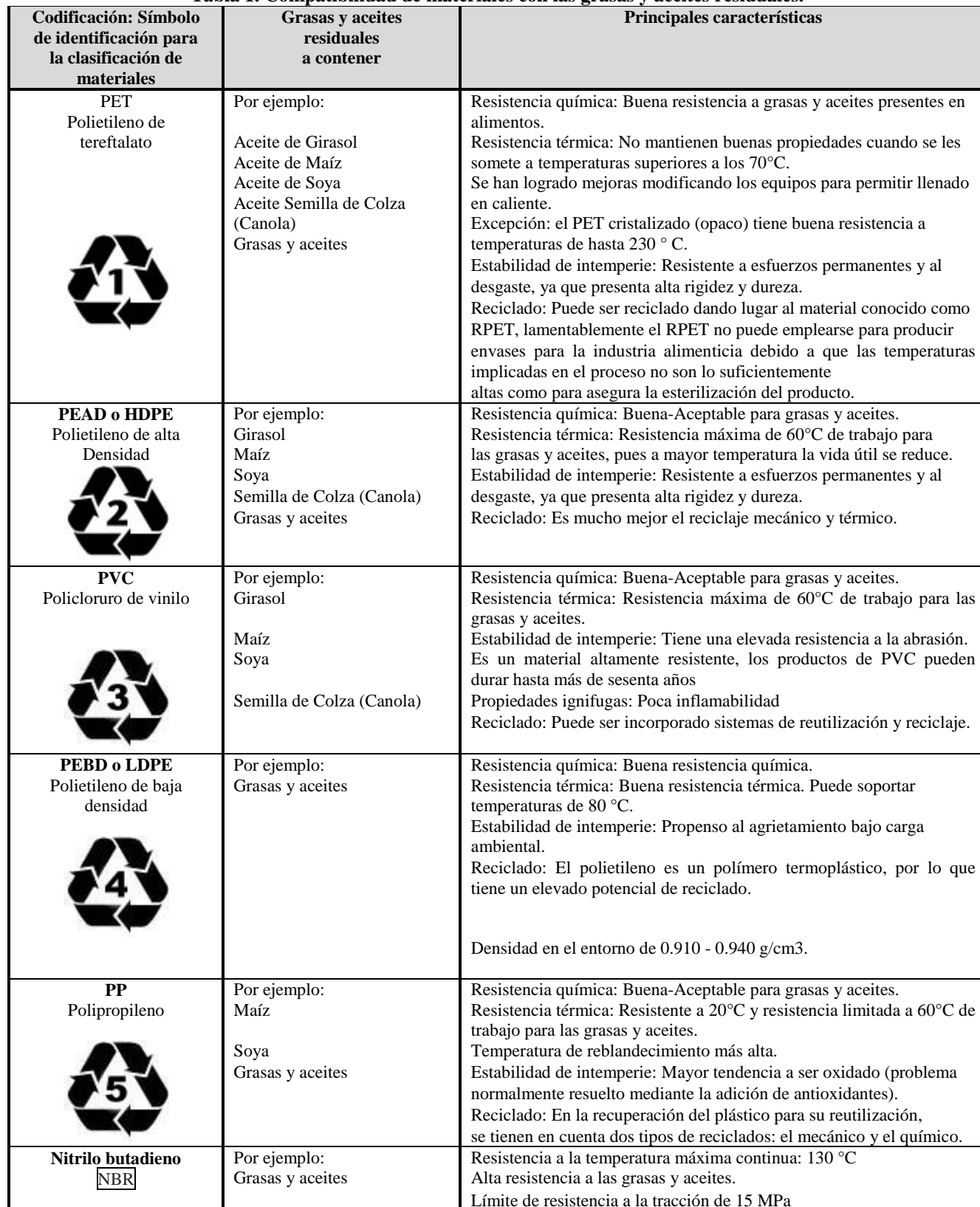
Tabla 1. Compatibilidad de materiales con las grasas y aceites residuales.