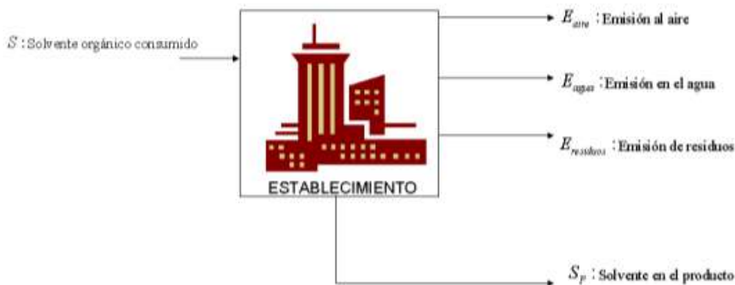
Diagrama 1 Balance sin equipo de control

Si E_{aire} es mayor al LMP de la tabla 1, las fuentes fijas no cumplen con los LMP.